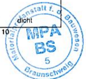
Tabelle: Kennwerte des Abdichtungssystems „MARISEAL 250“

Abkürzungen: x = Mittelwert, k = Kleinstwert, g = Größtwert, 1) eingestuft gemäß DIN 4108 Teil 10