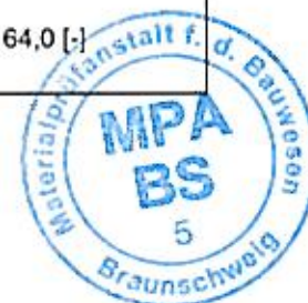
Tabelle: Kennwerte des Abdichtungssystems „MARISEAL 250“

Abkürzungen: x = Mittelwert, s = ± Standardabweichung k = Kleinstwert g = Größtwert